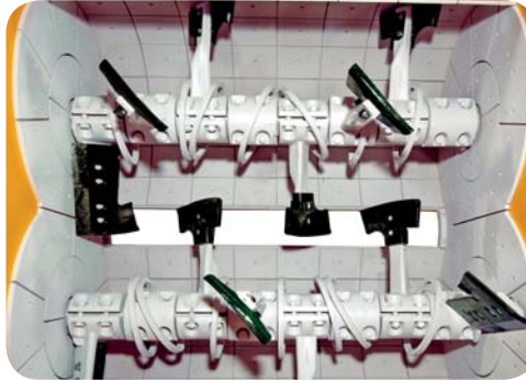
BETON MİKSERİ MİL ÜZERİ HAREKETLİ HALKALAR FOR MIXERS. MOVABLE CLEANING CIRCLES ON SHAFT.