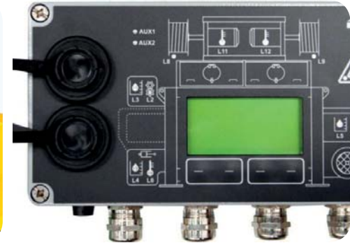
DİJİTAL MİKSER KONTROL ÜNİTESİ DIGITAL MIXER CONTROL UNIT