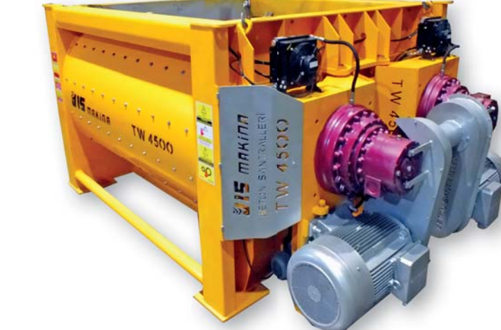
MENTEŞELİ AÇILIR TİP REDİKTÖR - MOTOR GÖVDELERİ