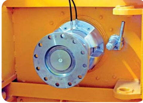
MANUEL REDİKTÖR İTME PİSTONLARI MANUEL REDİKTÖR