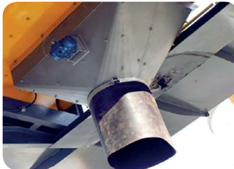
AŞINMA PLAKALI ve TİTREŞİMLİ ALT BETON BOŞALTIMA OLUĞU VIBRATING BOTTOM DISCHARGE CHUTE WITH LININGS