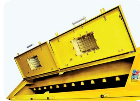
MİKSER BAKIM KAPAKLARI EŞİT ŞEKİLDE MİKSER İÇİ DAĞITICI SU TESİSATI MIXER INSPECTION HATCHES HOMOGENOUS WATER DISTRIBUTOR.