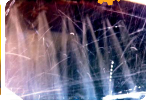
BASINÇLI MİKSER İÇİ OTOMATİK YIKAMA SİSTEMİ AUTOMATIC WASHING SYSTEM WITH HIGH PRESSURE.