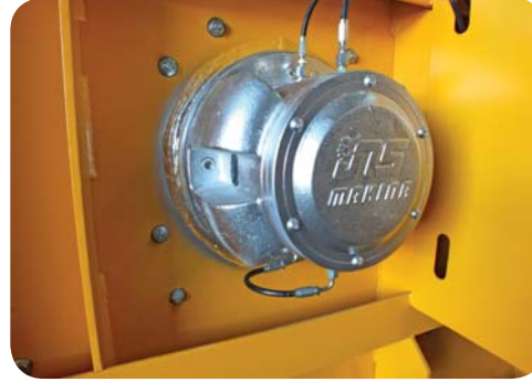
SIZDIRMAZ ARA BOŞLUKLU YATAKLAMA LEAKPROOF STEEL CAST BEARINGS.