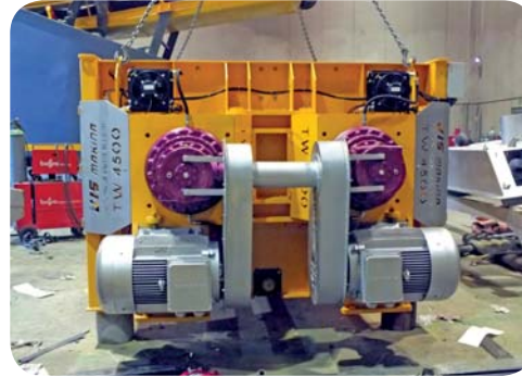
ÇİFT SOĞUTUCULU ISI AYARLI FANLI RADYA- TÖR SİSTEMİ RADIATOR SYSTEM WITH HEAT CONTROL AND DOUBLE COOLER