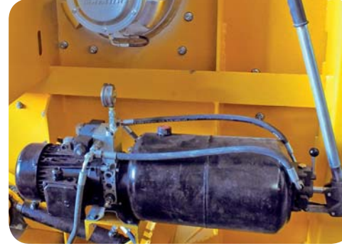
HİDROLİK ALT KAPAK SİSTEMİ VE MANUEL KAPAK AÇMA KOLU HYDRAULIC DISCHARGE GATE, AND MANUAL ARM FOR OPENING